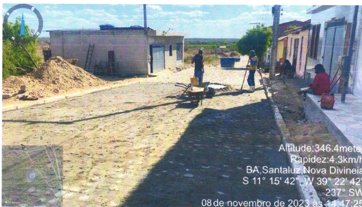
Execução de Pavimentação do Bairro Nova Divinéia, Rua F. Mascedo